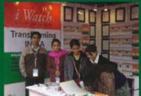
பிரைவாசி பாதுகாப்பு தலைப்பு, புதுதில்லி, இந்தியா