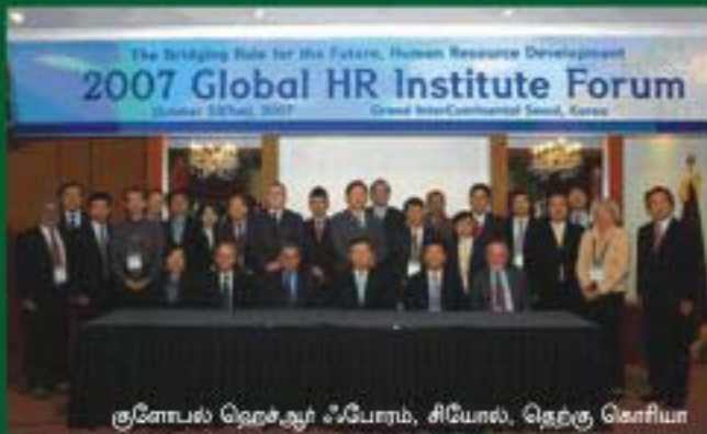
குளோபல் ஹெர் இன்ஸ்டிடியூட், சியோல், தெற்கு கொரியா

என்ஜிஓ பரிட்சைகளைப் பற்றி, லண்டன், புரீசு