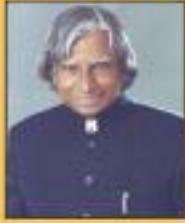
டாக்டர் ஏபிஜெ அப்துல் கலாம் முன்னர் இந்தியாவின் நான்காவது தலைவர்

இந்தியாவை மாற்றுவதற்கான சூயச்கள் இயக்கங்கள் மூலம் ; Wash உருவாக்கப் பட்டிருப்பது அறிந்து நான் பெருமகிழ்வடைகிறேன்.