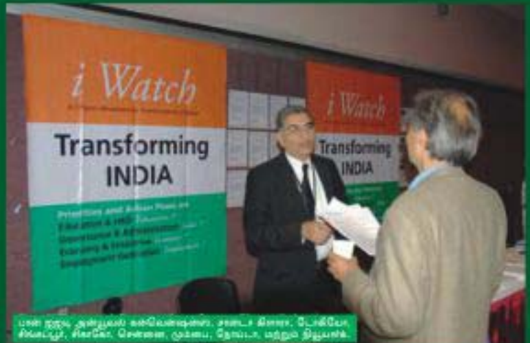
பள்ளியில் அறிவுரை வழங்கும்போது, லண்டன், டெக்ஸா, டிஸ்பர்சு, சிஎஃஓ, சென்னை, குடியரசு, நேயா, மற்றும் இலங்கை