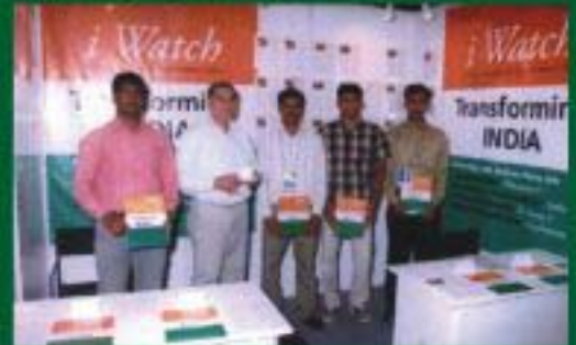
சிறு-செய்து வறுமையைக் குறைக்க, சென்னை, இந்தியா